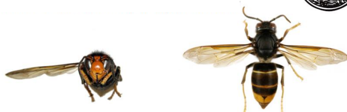
Frelon asiatique à pattes jaunes, Vespa velutina var. nigrithorax

Le frelon asiatique à pattes jaunes, Vespa velutina , est à dominante noire, avec une large bande orange sur l'abdomen et un liseré jaune sur le premier segment. Sa tête vue de face est orange, et les pattes sont jaunes aux extrémités . Il mesure entre 17 et 32mm.