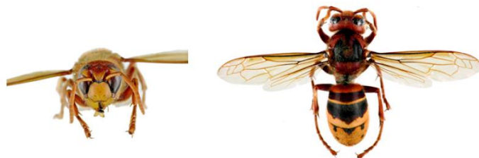
Frelon d'Europe, Vespa crabro

Le frelon d'Europe , Vespa crabro , a l'abdomen à dominante jaune clair, avec des bandes noires. Sa tête est jaune de face et rouge au dessus. Son thorax et ses pattes sont noirs et brun-rouges . Les ouvrières mesurent entre 18 et 23mm et les reines entre 25 et 35.